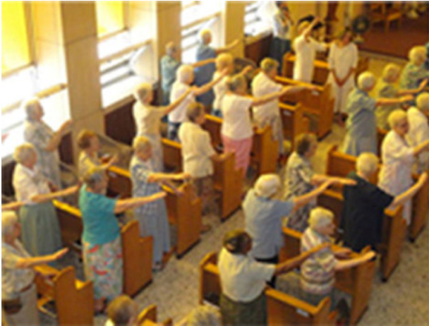
Bénédition des capitulantes par l'assemblée Blessing of the capitulants by the assembly Bendiccion de las capitulantes