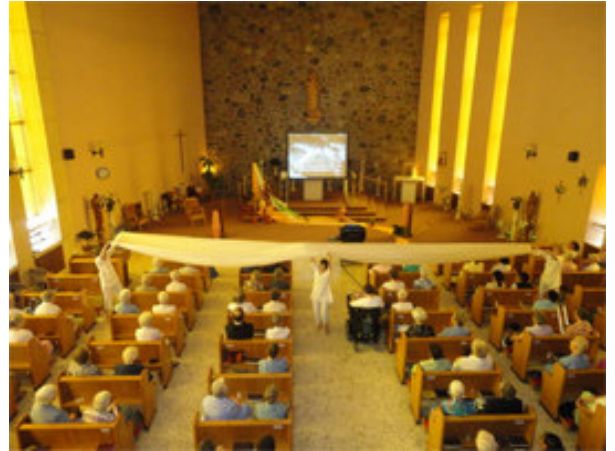
L'Esprit – Saint descend sur les capitulantes. The Holy Spirit flows over the capitulants. Espiritu Santo descende sobre las capitulantes