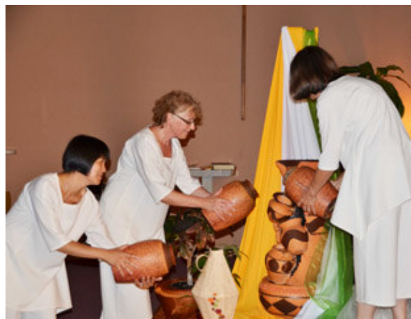
Rituel de l'eau vive Living water ritual Rito de agua viva